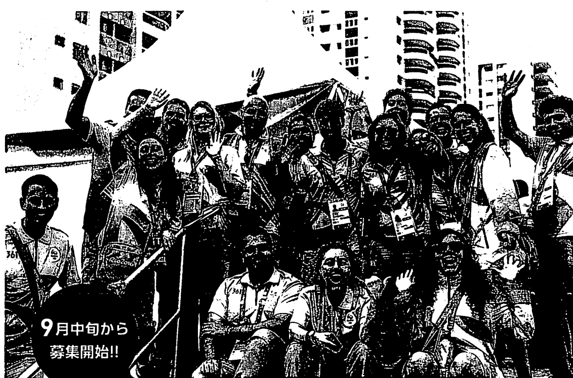
リオ2016大会で活動するボランティア